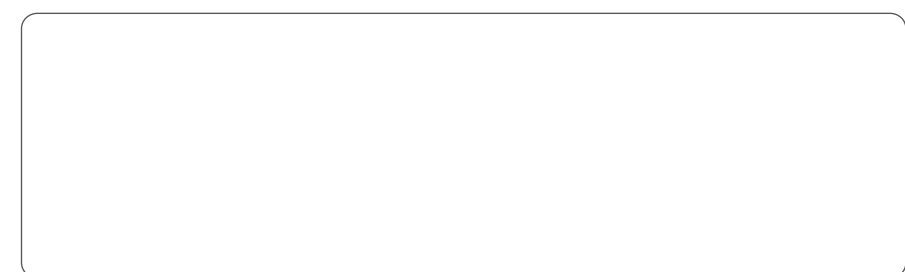
Item N17XX - Ver. 4.0 [Side A]

Begrenzte Garantie SLP gewährt für den Gliedmaßenbewegungssensor eine Garantie gegen Material- und Herstellungsfehler für einen Zeitraum von zwölf Monaten ab Kaufdatum. SLP oder unser(e) Händler haften nur für den kostenlosen Ersatz oder die Reparatur des Produkts nach Ermessen von SLP, falls ein Teil Herstellungs-, Betriebs- oder Materialschäden während der Garantiezeit aufweist. SLP oder unsere Händler sind unter keinen Umständen für jeglichen Einnahmeverlust oder Schaden haftbar, sei er direkt, ein Folge- oder zufälliger Schaden, einschließlich Gewinnverlust, Schaden an Eigentum oder Person, der sich durch den Einsatz oder die Nichtensatzfähigkeit dieses Produkts ergibt. Diese Garantie gilt für den eigentlichen Käufer und ersetzt alle anderen Garantien oder vorherigen ausdrücklichen oder implizierten Vereinbarungen. Sie wird hinfällig, wenn das Produkt nicht für seinen eigentlichen Bestimmungszweck verwendet wird, unsachgemäß behandelt wird, oder wenn unbefugte Veränderungen vorgenommen werden. Die Verwendung dieses Produkts stellt eine Zustimmung zu diesen Garantiebestimmungen dar.